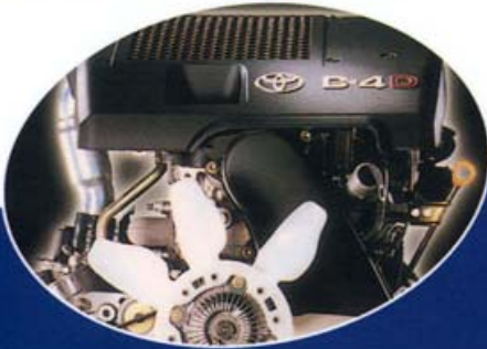
محرك تريبو ديزل 2KD-FTV ٢,٥ لتر الذي يعمل بالديزل